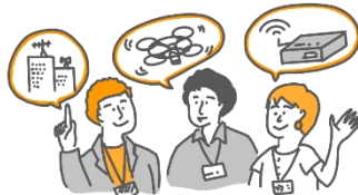
会員企業詳細情報