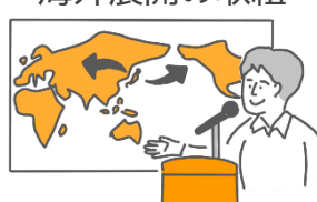
会員企業による 海外展開の取組