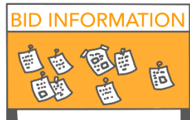
国際機関の入札情報